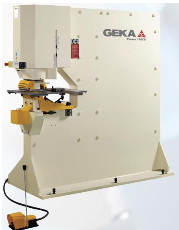
PUMA 165 S

Hydraulisk hålstansmaskin i kraftigt utförande. Hög teknisk kvalitet och standard som ger stor kapacitet och lång livslängd. Maskinen har dubbelverkande cylinder med kraftiga lagringar för att undvika onödigt slitage på verktyg. Mekanisk slaglängdsinställning för maximalt utnyttjande.