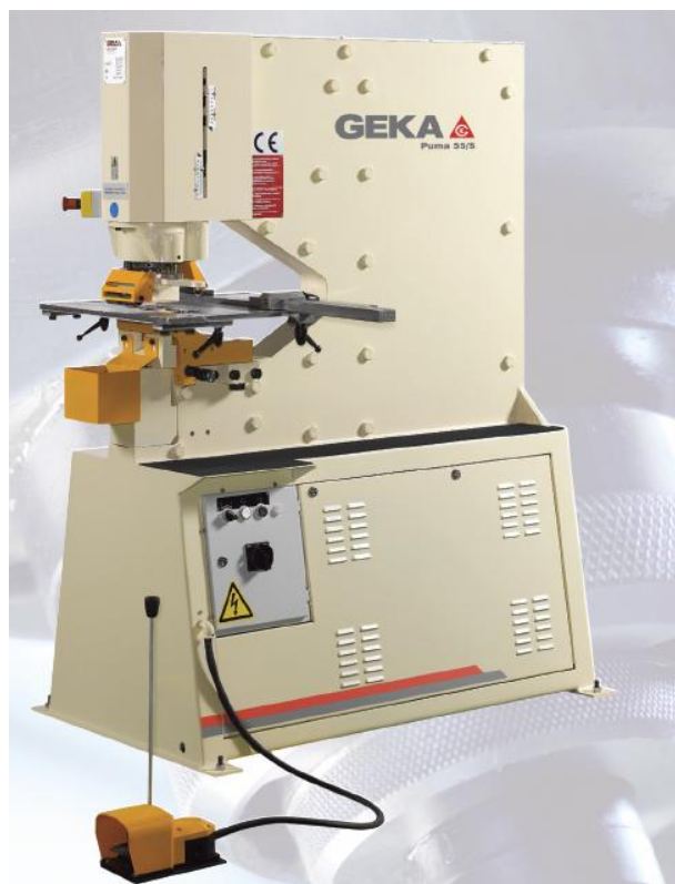
PUMA 55 S